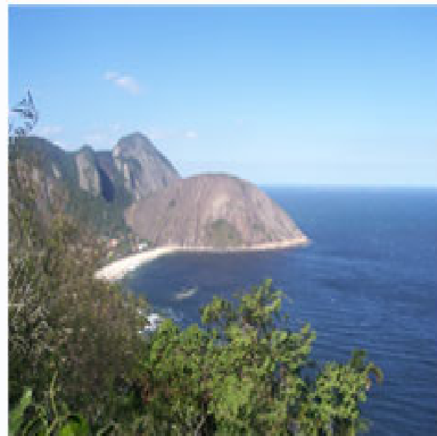
As cidades que cuidarem da água, lixo e florestas receberão ICMS Verde

Calcula-se que o repasse anual para as prefeituras que investirem na manutenção de florestas, de fontes de água e no tratamento de lixo alcançará R$ 100 milhões, em 2011. O ICMS Verde começa a valer a partir de 2009.